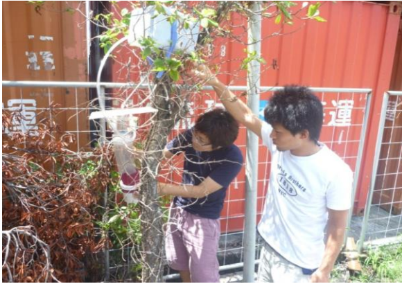
那覇港でライトトラップを設置する学生