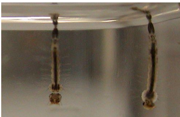
ヒトスジシマカ幼虫 (琉球大学医学部構内)