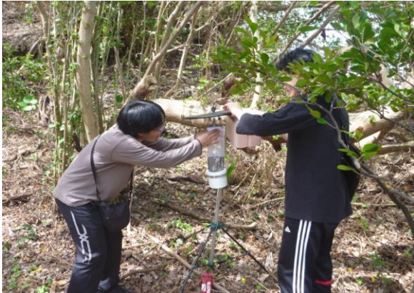
那覇空港内でライトトラップを設置する学生