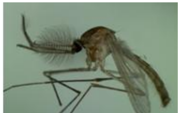
ネッタイエカ成虫 (那覇港)