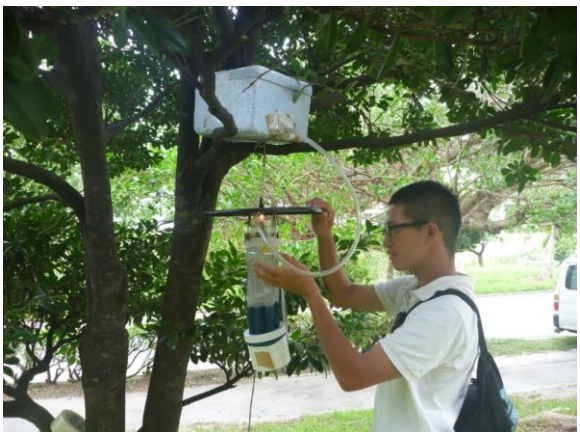
琉球大学医学部構内でライトトラップを設置する学生