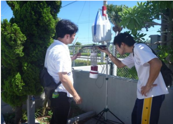
金武中城港内でライトトラップを設置する学生