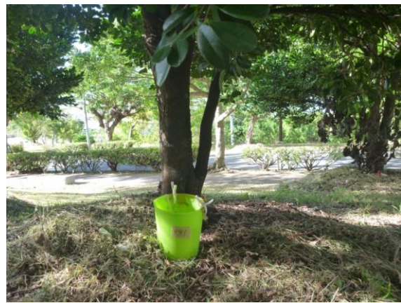
琉球大学医学部構内に設置したオビトラップ