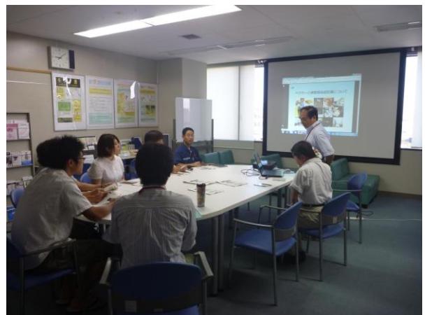
蚊の講義 (那覇検疫所)