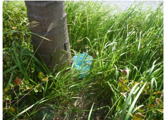
金武中城港内に設置したオビトラップ