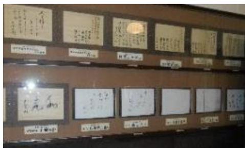
【来所した著名人の短歌等】