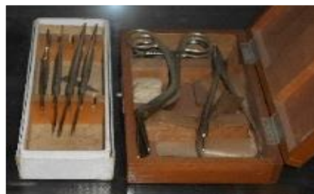
【感染症患者等への診察器具】