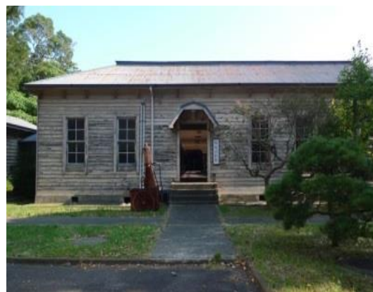
【外観(西側より撮影)】