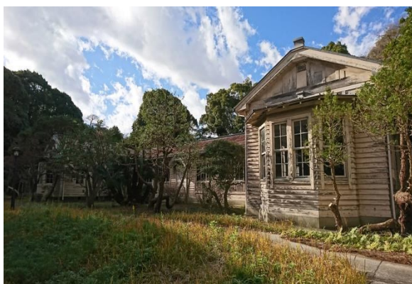
【外観(海側より撮影)】