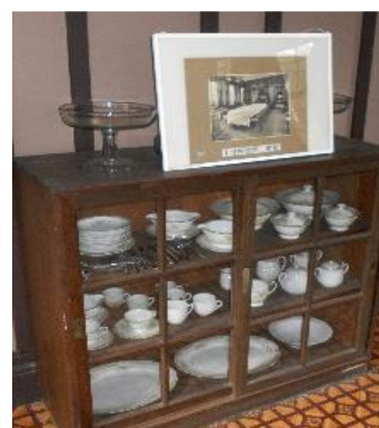
【当時使用していた食器類】