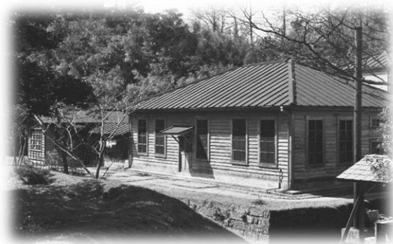
【野口英世が細菌検査に 従事した細菌検査室】