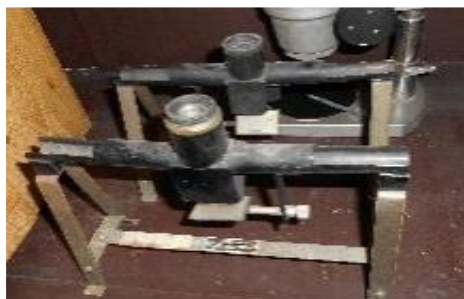
【検疫に使用した検査機器】