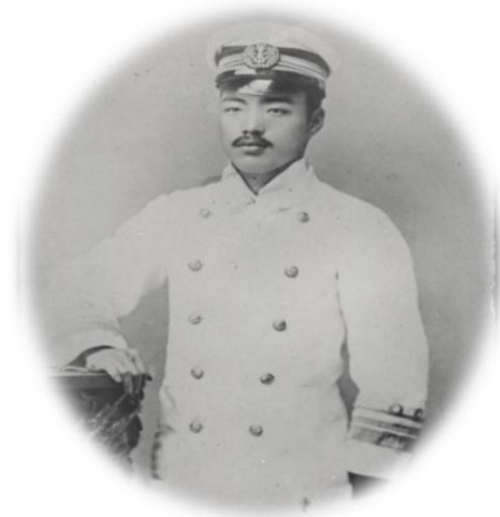
検疫医官補時代の野口英世