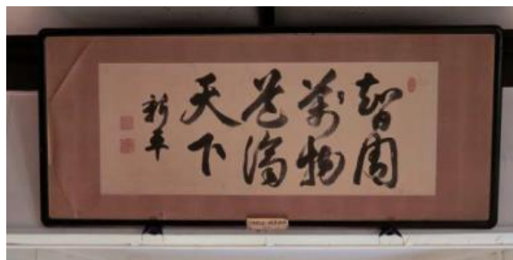
【（伝）後藤新平の直筆の書】

※「薬学（医）の道は、智のとびらを開く世の中の人を守る筋道である」と解釈される。