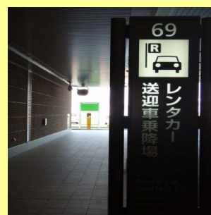
1Fへ降りて一度外へ 69レンタカー送迎車 乗降場の案内表示板を直進