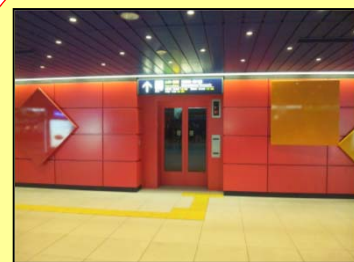
改札口正面のエレベータで 2階連絡通路へ