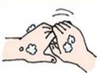
⑤指の間(指の側面)、股を洗う