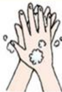
③手のひら・指の腹面を洗う