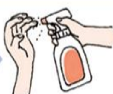
⑪アルコールによる消毒