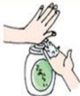
②洗剤を手に取り泡立てる