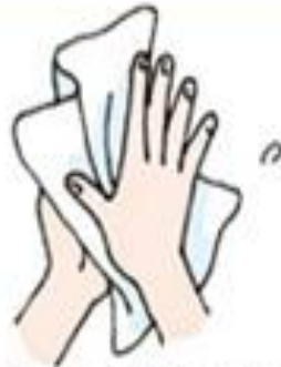
⑩手をふき乾燥させる