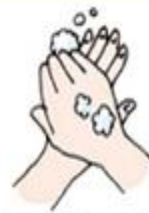
④手の甲・指の背を洗う