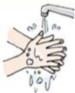
⑨石けんをよく洗い流す