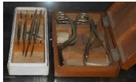
【感染症患者等への診察器具】