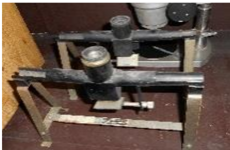
【検疫に使用した検査機器】