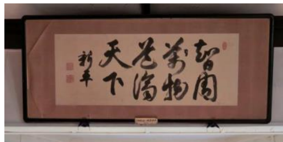
【（伝）後藤新平の直筆の書】

※「薬学（医）の道は、智のとびらを開く世の中の人を守る筋道である」と解釈される。