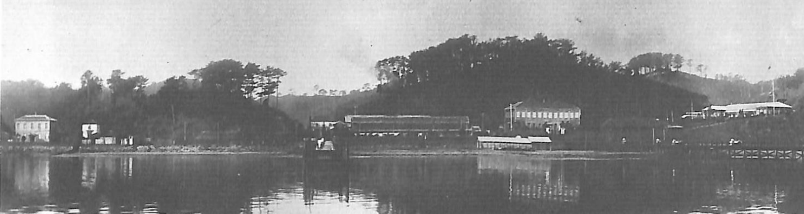
設置された頃の横浜検疫所(明治28年頃撮影)