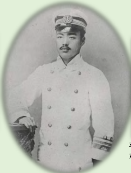
検疫医官補時代の野口英世