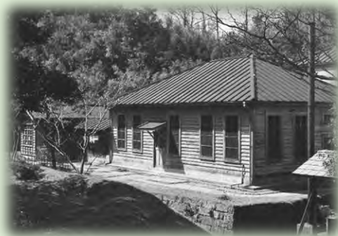
野口英世が細菌検査に従事した 細菌検査室