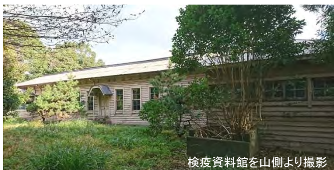
検疫資料館を山側より撮影

お問合せ先:横浜検疫所総務課 横浜市中央区海岸通1-1 (横浜第二港湾合同庁舎) TEL 045-201-4458 / Fax 045-201-3302