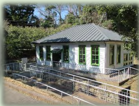
平成9年(1997年)5月にオープンした野口記念公園内に復元された細菌検査室